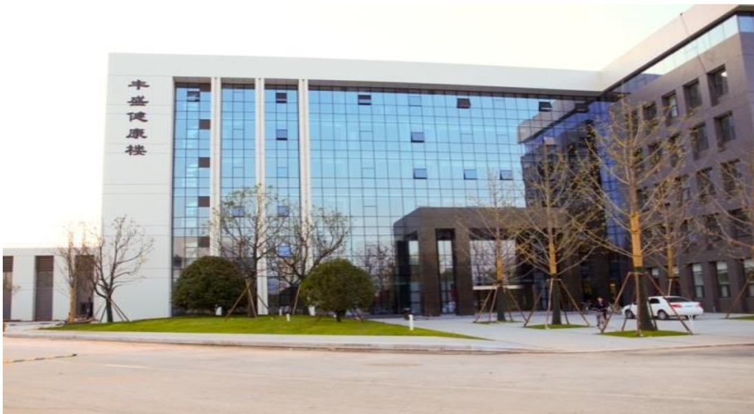
南中医丰盛楼实景图