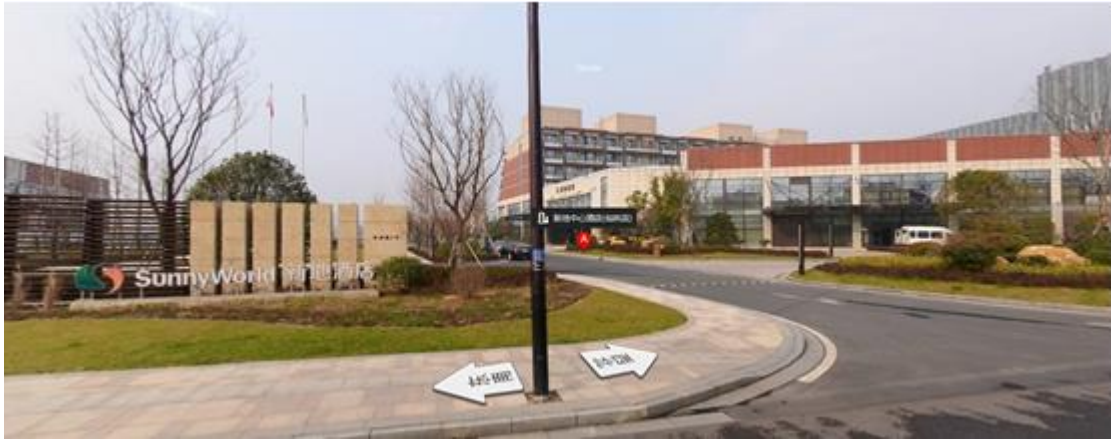
新地中心酒店实景图